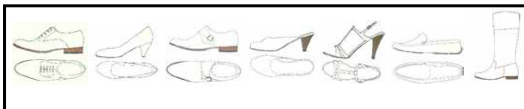
تصویر ۱. هفت استایل اولیه در طراحی کفش

استایل اصولاً به برش یا طراحی مشخص و متمایزی از یک شیء مثل کفش یا لباس گفته می‌شود که آن را از دیگر انواع موجود متفاوت می‌سازد. در طراحی کفش، هفت استایل اولیه و اصلی وجود دارد که سایر کفش‌ها، هرچند مدرن و جدید، همگی جزء یا شکل تغییر یافته‌ای از این گروه محسوب می‌شوند. این استایل‌ها عبارتند از: موکازین، صندل، میول، مونک، بوت، پامپ و آکسفورد (تصویر ۱). از این موارد، استایل موکازین قدیمی‌ترین گزینه است و تاریخ آغاز آن به ۱۲ هزار سال قبل می‌رسد و آکسفورد جدیدترین استایل طراحی بوده و مربوط به ۳۰۰ سال پیش است.